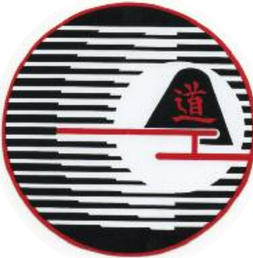
Le logo du "Centre de Recherche Budo" (CRB) créé par Sensei Habersetzer: une étonnante ressemblance, dans une version moderne, avec la composition de Sensei Yagi.

Mais cette évolution intérieure n'est vraiment digne d'intérêt que si elle déteint. Si "vivre (vraiment) mieux" avec soi-même, c'est aussi "vivre mieux" avec les autres, dans une coexistence pacifique qui pourra assurer le bien-être de tous. L'art martial débouche alors sur une conséquence inattendue : il devient une Voie d'Humanisme. Parce que comprendre ses possibilités comme ses limites, ses côtés positifs comme ses recoins obscurs, et les accepter, savoir aller sans complaisance jusqu'au bout de ses peurs et de ses pulsions en ne se trouvant d'excuse jamais, en restant modeste toujours, c'est dans le même temps découvrir en soi les éléments de la compréhension des autres, donc d'un rapprochement. Avancer fermement sur la "Voie", ne pas se contenter de toutes ces apparences qu'elle peut un court instant donner, c'est apprendre les réalités de la vie, et en particulier distinguer ce qui est réellement important de ce qui ne vaut pas la peine de risquer une confrontation stupide et incontrôlable. Ceci est au centre de ma "Voie Tengu" © (Tengu-no-michi). Un vrai pratiquant du "martial" est surtout efficace parce qu'il a appris à éviter la confron-