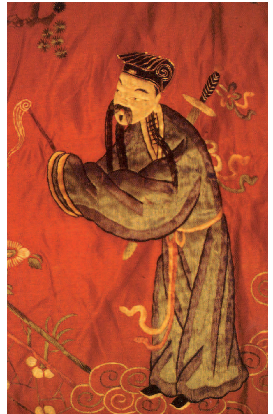
« Lorsque le monde est en paix, un homme de bien garde son épée à son côté ». (Ho Yen Si : « Les stratégies de Wu », 11 e siècle apr. JC). Un concept bien illustré par cette image trouvée au musée « Secrets de soie » (Campel, France).

une obsession). C'est toujours ainsi que j'ai considéré le rôle d'un « Sensei », conscient de la confiance qui est mise en lui. Et de sa responsabilité dans ce qu'il donne comme bagage, extérieur (pour faire face à l'adversaire extérieur) comme intérieur (pour faire face à l'éternel ennemi intérieur, l'ego). Que cela soit un choix difficile à assumer, surtout par les temps qui courent, est une évidence, mais ne doit rien changer à l'affaire. Alors, non, les véritables arts martiaux ne rendent pas faibles « par définition »... Sauf à ne vouloir y voir que le contenu qui leur est aujourd'hui trop souvent donné dans un cadre classique, où l'enseignement d'une routine anesthésiante et dangereuse tient lieu de moyen de défense jamais remis en cause. L'auteur de ce blog a l'air de découvrir la critique que je faisais de la dérive des arts martiaux "sportifs" il y a déjà plus de 40 ans, et que je martelais à qui voulait l'entendre (??) dans force articles et livres (1). Il n'a donc pas tout à fait tort, hélas, dans la vision qu'il peut avoir aujourd'hui de ce qu'est devenu un « martial » bien dépourvu de sa fibre originelle. Il évoque en fait un regard qui est mien depuis longtemps, et qui m'avait aussitôt mis à l'écart du monde de la copie sportive du