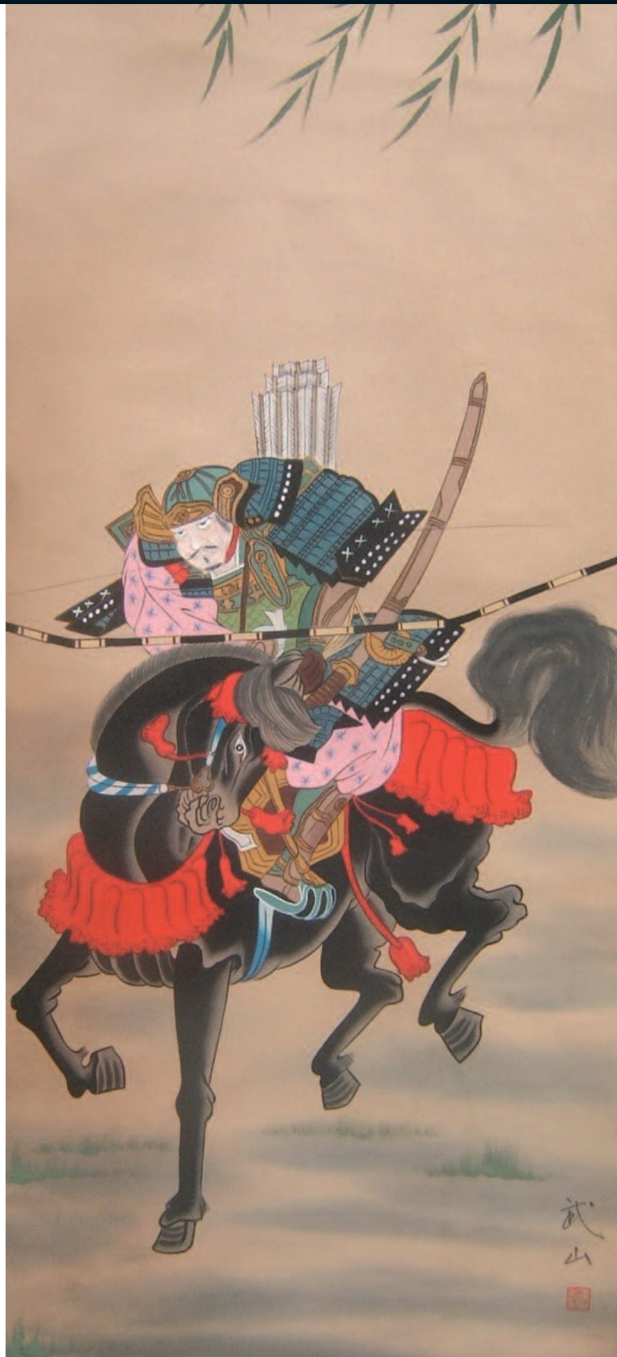
Samouraï sur le chemin de la guerre.

Rappelons donc simplement que l'on peut certes pratiquer aujourd'hui des "gestuelles de combat" de quantité de manières. Il y a un marché, une demande, une offre plus que pléthorique, entraînant une confusion grandissante auprès d'un public prêt à suivre le dernier qui aura parlé, ou parlé le plus fort, ou auréolé des palmes de la vedette, ou vu à la télé, ou encore faisant étalage d'impressionnants vécus (de ceci ou de cela, ici ou là-bas, vérifiables ou pas). On agit sur un vivier de clients potentiels, effrayés par une violence possible à chaque coin de rue, de jour comme de nuit, ciblant toutes les catégories d'âges. On puise, pour les rassurer sur leurs chances de survie, dans un large stock de techniques de défense que les humains ont toujours connues à toutes les époques, sur toute la planète, avec ou sans armes, avec des noms différents selon les lieux. On n'a toujours pas fini d'en « découvrir » ici ou là, au fond de quelque espace jusque-là inaccessible, de ces techniques « oubliées » ou « secrètes » censées révolutionner la donne. De plus en plus divulguées par des « experts » et « maîtres » qui ont fait le tour de tout dès qu'ils sont arrivés à l'âge de 30 ans (pour les plus modestes). Ce que je vois en feuilletant tant de pages consacrées à ce nouveau business est affligeant, tant tout ce qui y est illustré de manière récurrente est d'une banalité extrême. Pire parfois, lorsque l'on illustre des ripostes dangereuses (pour celui qui les exécute, no-